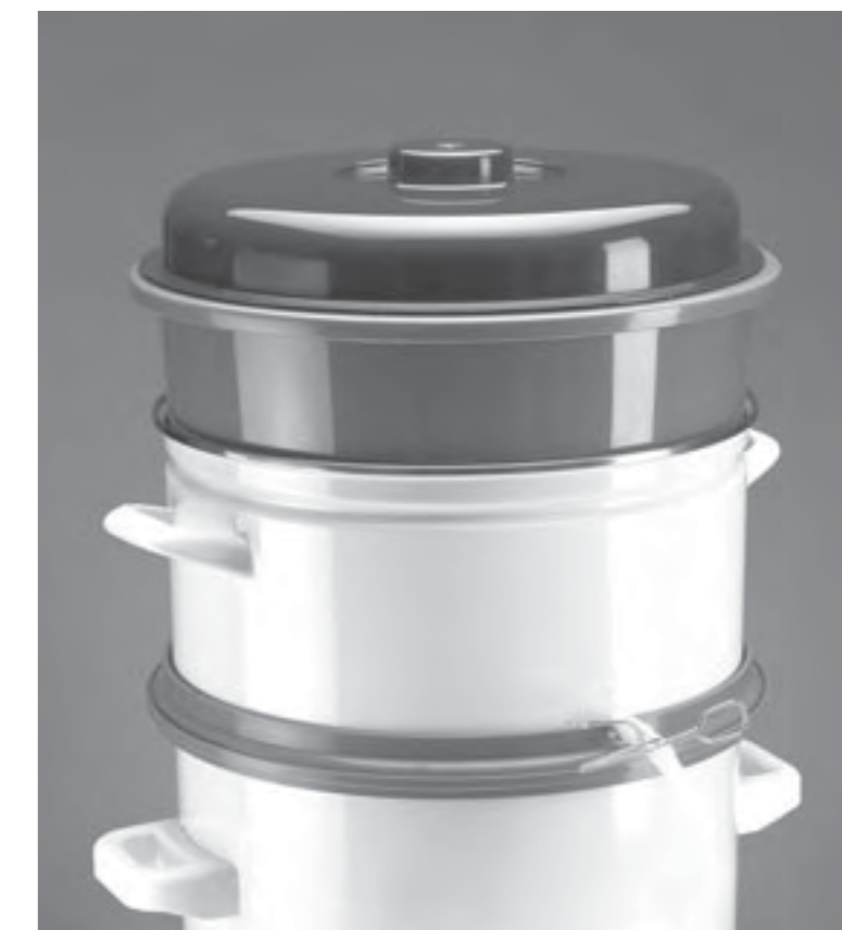
Entsafteraufsatz EA 1803 · EA 2003/E