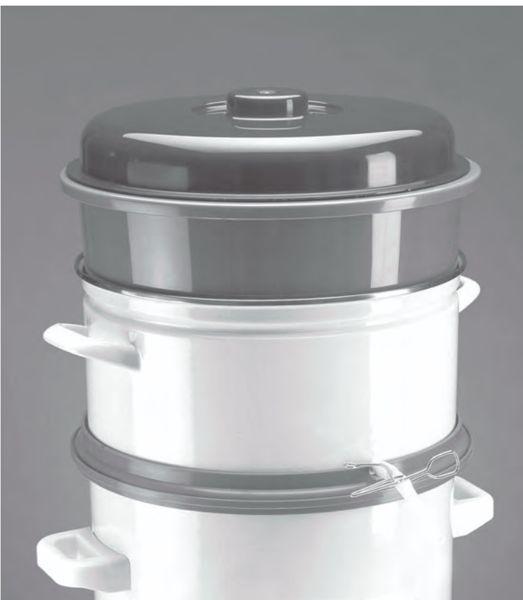
Entsafteraufsatz EA 17

We are very pleased that you chose this product and would like to thank you for your confidence. To make sure you will have lots of pleasure with your new Juice Extraction Top please observe the following notes carefully, keep this instruction manual for future reference and pass it on to any user.