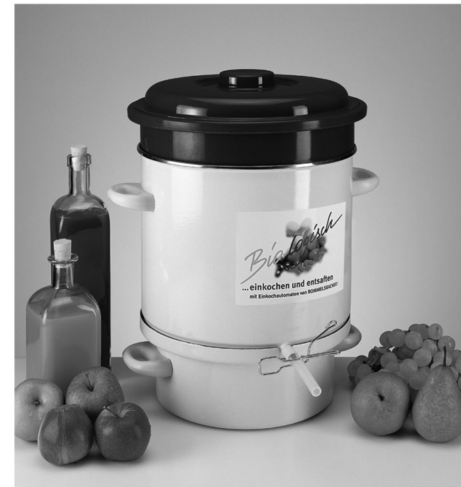
Herd-Entsafter HE 630