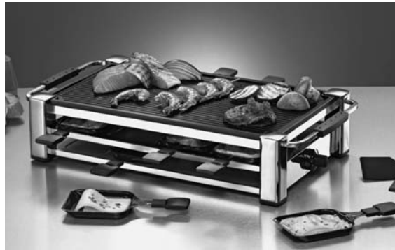
Raclette Grill Fashion RCC 1000 & RCC 1500