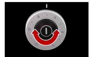
Individuelle Einstellung der Pulvermenge