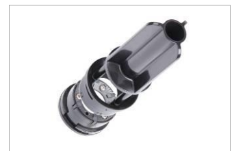
Leises, aromaschonendes Scheibenmahlwerk