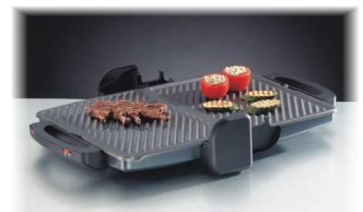
als Tisch- und Partygrill