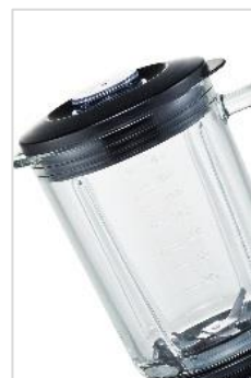
stabiler Glaskrug mit 1,8 l Inhalt