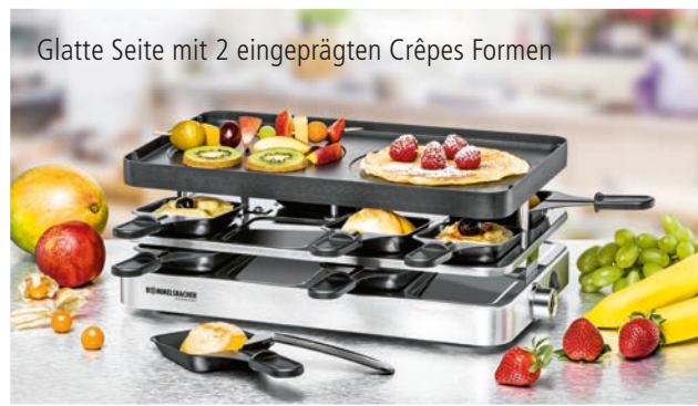
Glatte Seite mit 2 eingepprägten Crêpes Formen