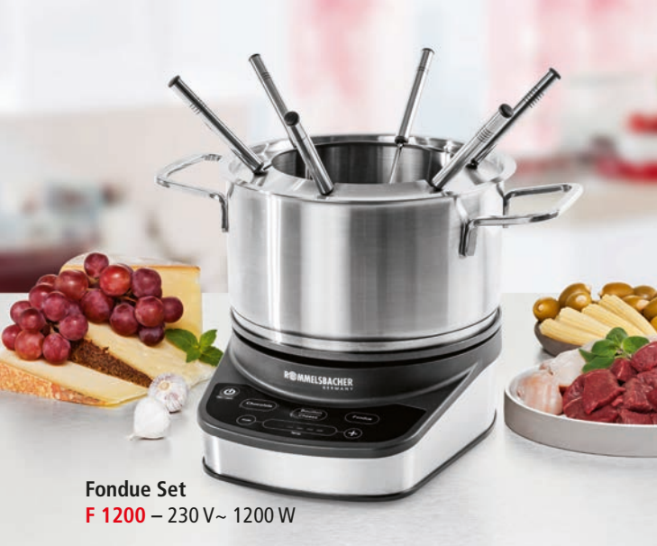
Fondue Set F 1200 – 230 V~ 1200 W