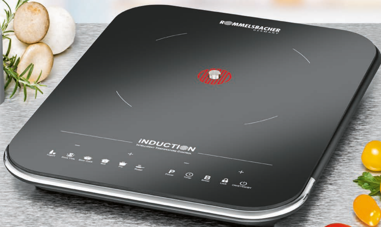
Einzelkochplatte Induktion CTS 2000/IN – 230 V ~ 2000 W