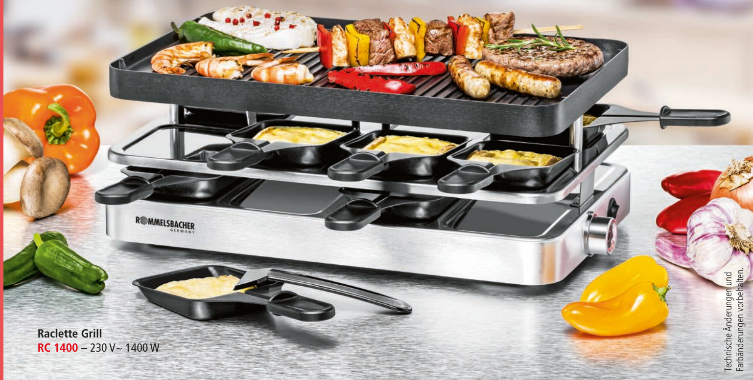
Raclette Grill RC 1400 – 230 V~ 1400 W

Technische Änderungen und Farbänderungen vorbehalten.