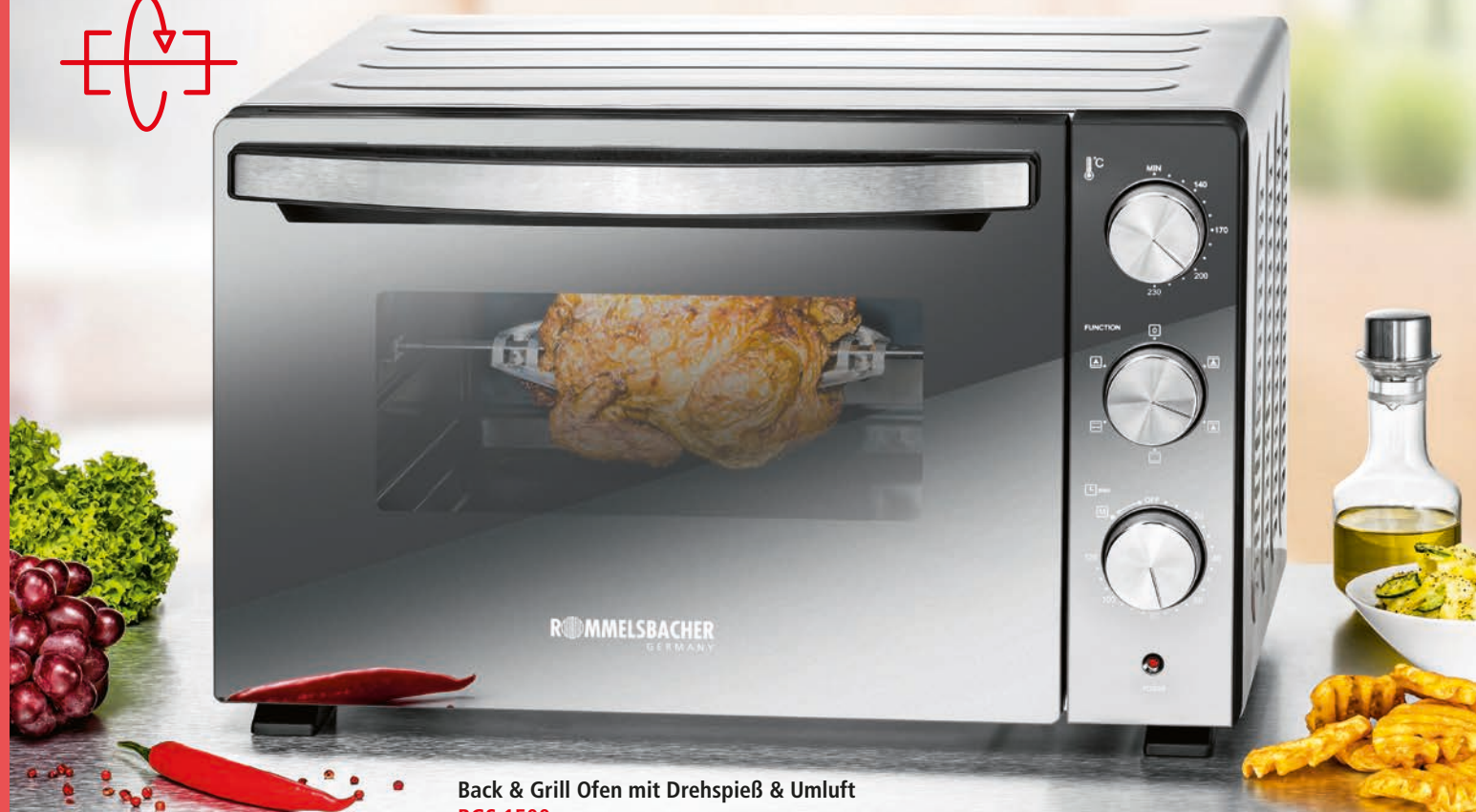
Back & Grill Ofen mit Drehspieß & Umluft BGS 1500 230 V~ 1500 W