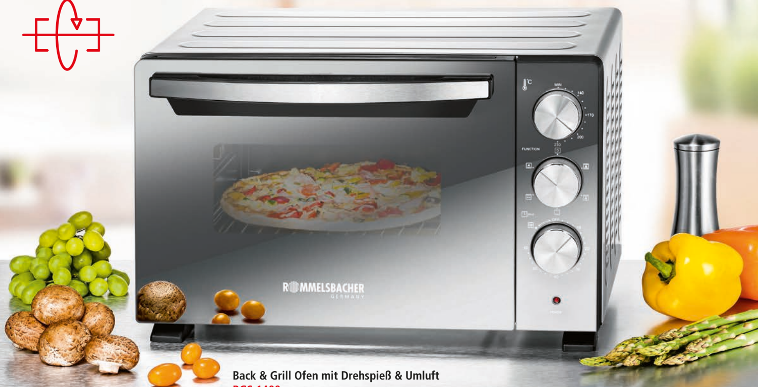
Back & Grill Ofen mit Drehspieß & Umluft BGS 1400 230 V~ 1380 W